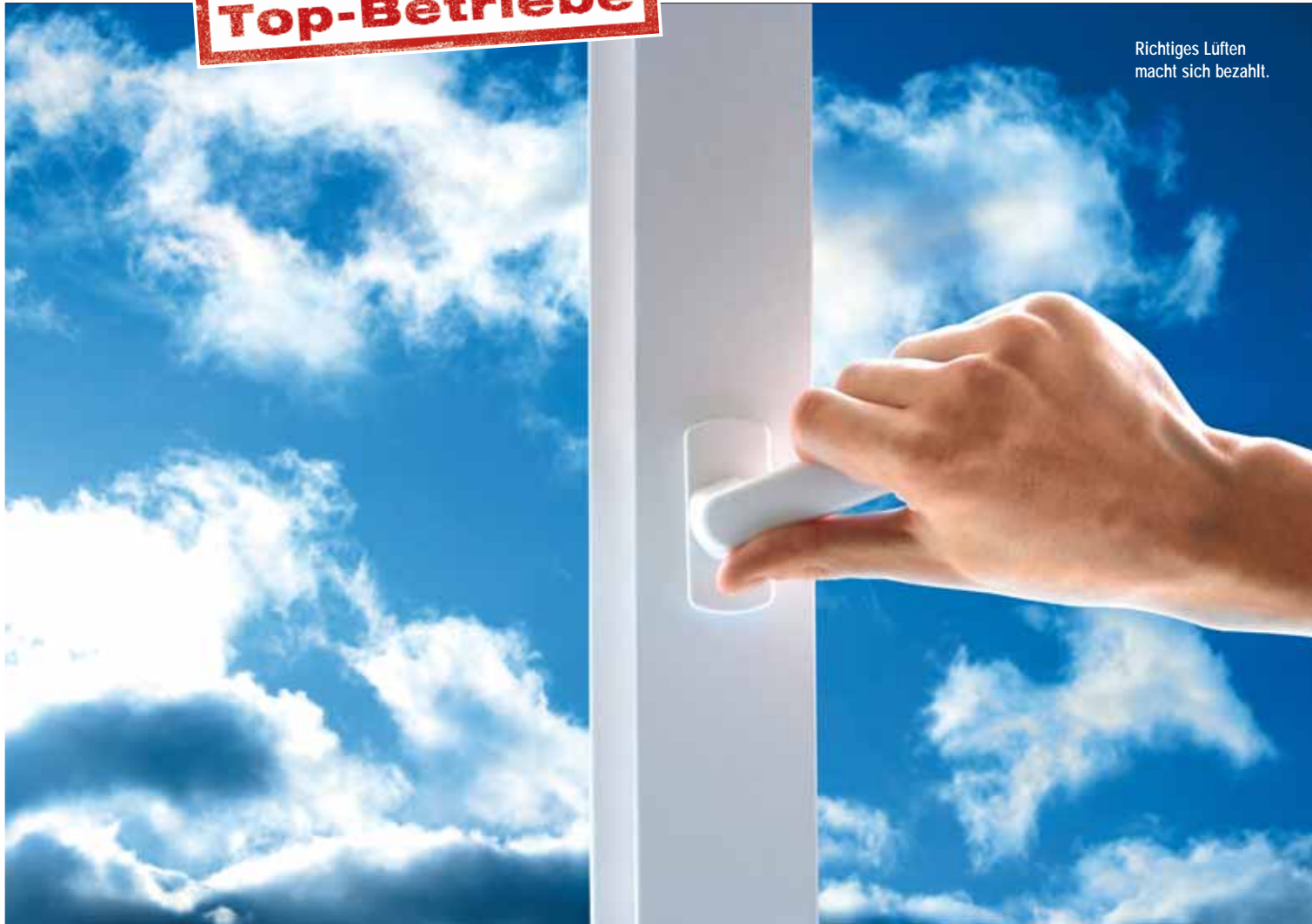
Richtiges Lüften macht sich bezahlt.