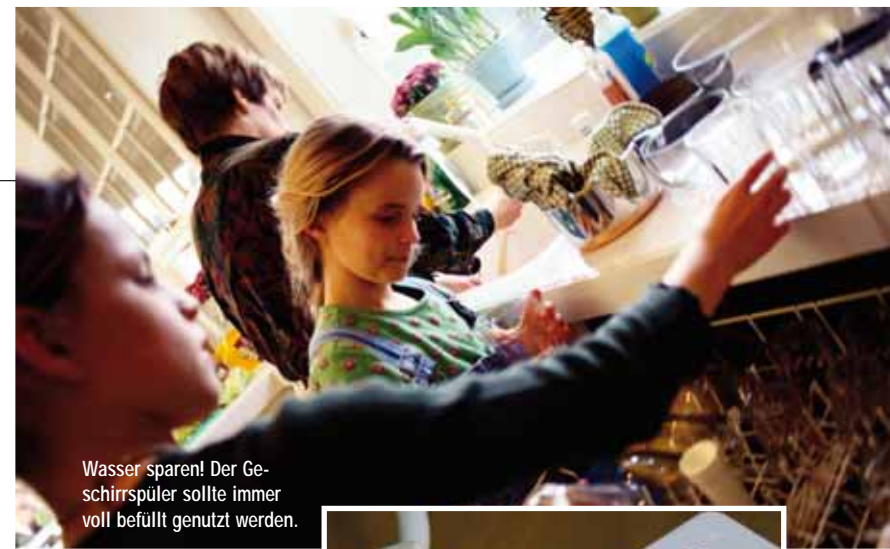
Wasser sparen! Der Geschirrspüler sollte immer voll befüllt genutzt werden.