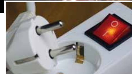
Eine Investition, die sich schon nach kürzester Zeit rechnet.

müssen und alle Räume gleichmäßig warm sind, oder ob es im Wohnzimmer wärmer sein sollte als in den Schlafräumen. Außerdem soll die Heizung regelmäßig entlüftet werden, das spart Energie und geht einfach. Wenn es in der Heizung glückt, ist es Zeit für eine Entlüftung.